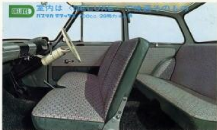
コクピットを押しこむように倒れるリクライニングシート。肘も倒れるラクな姿勢が主眼。さらに肘はほぼ水平に